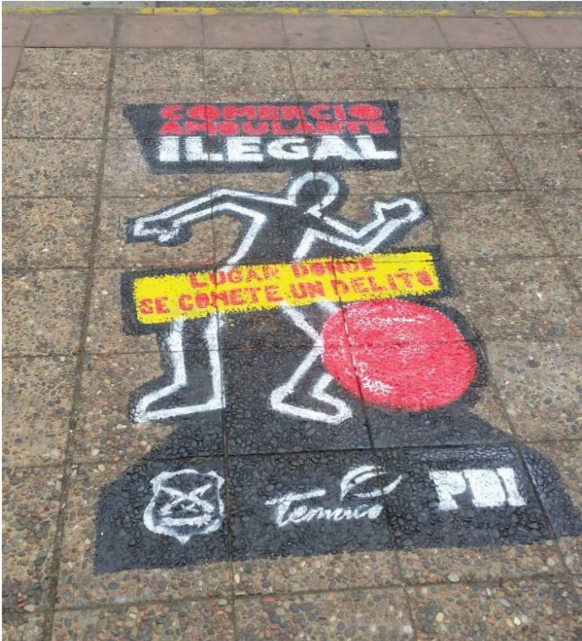
Figura 5. Pintura en la vía pública

En este sentido, se observa cómo, a través del proceso de ilegalización (Pires, 2020; Telles y Hirata, 2007), se construye un tipo de sujeto sobre el cual deben actuar los equipos de seguridad, así como también a través del juicio moral de quiénes son sus compradores, teniendo además una función económica al establecer las condiciones de empleabilidad precarizada (Correa y Merino, 2022) sostenida en su deber de buscar otra forma moralmente aceptada de trabajo.