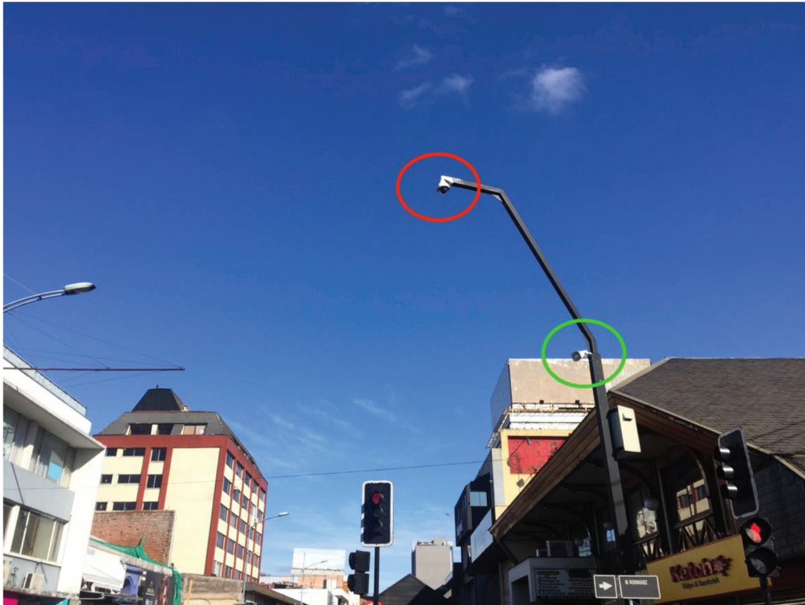
Figura 4. Dispositivos de seguridad y vigilancia

Nota: Cámaras de seguridad (en rojo) y dispositivo de altavoz en altura (en verde).