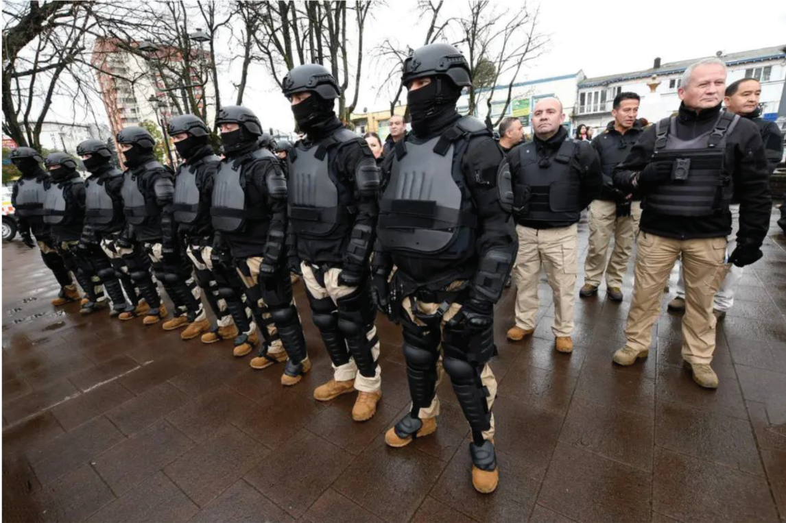
Figura 2. Personal de seguridad con equipo táctico