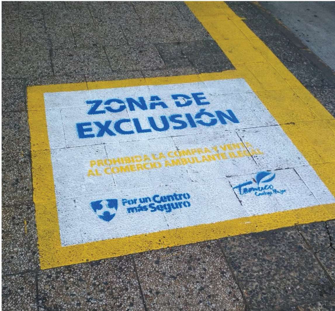
Figura 3. Demarcación del perímetro de exclusión

Las estrategias de control y disciplinamiento en la ciudad avanzaron a través del uso de dispositivos electrónicos de vigilancia (Arteaga, 2010) los que, a la ya asentada red de cámaras de vigilancia, dirigidas a la seguridad pública, se implementa el uso de bocinas de altavoz y avanzados equipos de sonido para desplegar mensajes alusivos a las multas y la vigilancia de las actividades ambulantes que cada media hora instaban a “no comprar al comercio ambulante” por ser “ilegal”; así como también el advertir el hecho de arriesgar multas si se es sorprendido comprando a un trabajador callejero, apelando siempre a la responsabilidad individual y a la reflexividad de los usuarios (Figura 4). Estas estrategias son lo que Nikolas Rose (1999) denomina como “tecnologías del psi”, y que estarían orientadas a producir agentes, subjetividades y formas de saber que estén al