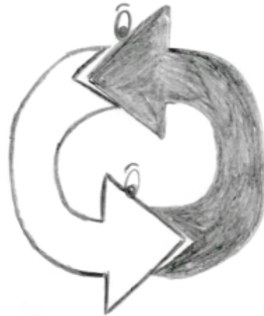
Figura 1. Dibujo del sujeto 1

Es decir, las flechas se pueden personificar. Incluso la diferencia de direcciones, siempre que sea respetada puede dar lugar a la creación de cosas que solo es posible mediante la unión de fuerzas. Es así como se me ocurre crear una rueda con las dos flechas, ya que es la propia acción de la diferencia y la confluencia entre las dos personas que forman la pareja la que hace avanzar la relación [ver figura 1].